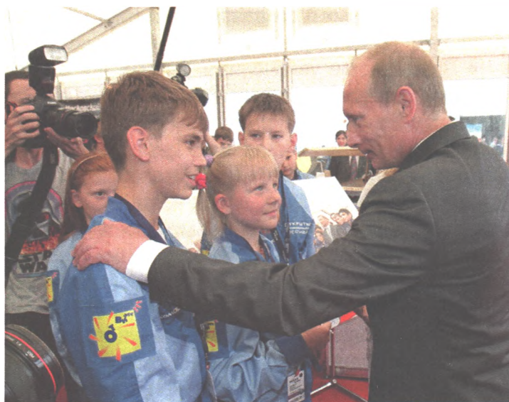
В.В. Путин среди участников детской экспозиции на МАКС - 2009

4. Этап обновления и совершенствования системы- усложняются цели, более разнообразным становится содержание, более тонкими - отношения, более разветвленными. Происходит осознание ребенком, что ему под силу решить сложную инженерную задачу. На этом уровне ребенок начинает мыслить масштабно и нестандартно. Одним из примеров этого может быть применение не только электроприводов на детских моделях, но и гидроприводов.