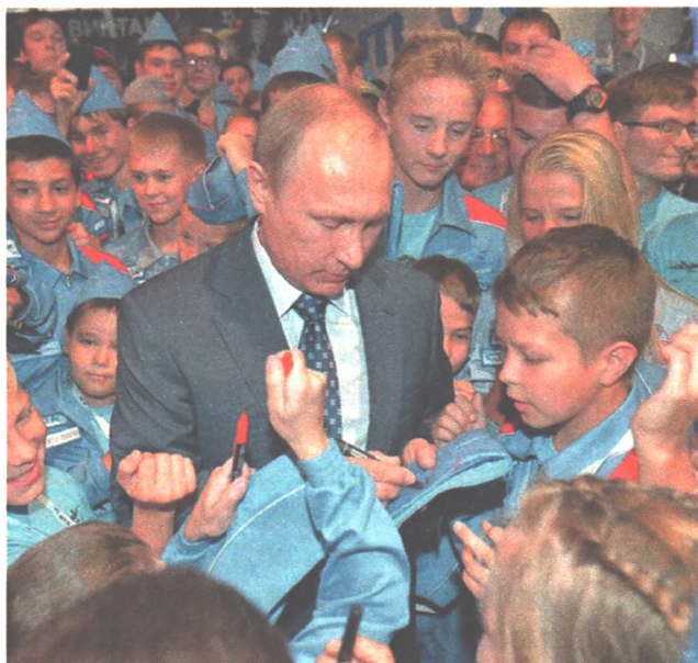
В.В. Путин среди участников детской экспозиции на МАКС - 2015

МАКС. Участие в Международном Авиакосмическом Салоне стало уже традиционным для юных техников. Впервые мы приняли участие в детской экспозиции МАКСа в рамках Международного фестиваля детского авиакосмического творчества «От винта!» в 2007 году, потом в 2009, 2011, 2013, 2015, 2017. Участие в фестивале такого уровня готовит все новые поколения юных техников к проектированию авиационной и космической техники. И это они уже меня тянут на МАКС.