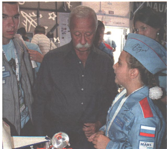
Леонид Якубович среди участников детской экспозиции на МАКС - 2015

3. Этап получения опыта самостоятельного общественного взаимодействия. Рамки урока становятся тесными, начинаются поиски более емких и гибких форм коллективного познания. Идет интеграция учебной и внеучебной деятельности. На этом уровне ведущими становятся уже дети.